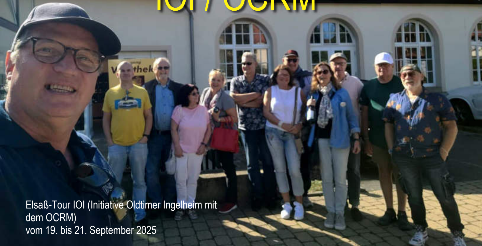
Elsaß-Tour IOI (Initiative Oldtimer Ingelheim mit dem OCRM) vom 19. bis 21. September 2025